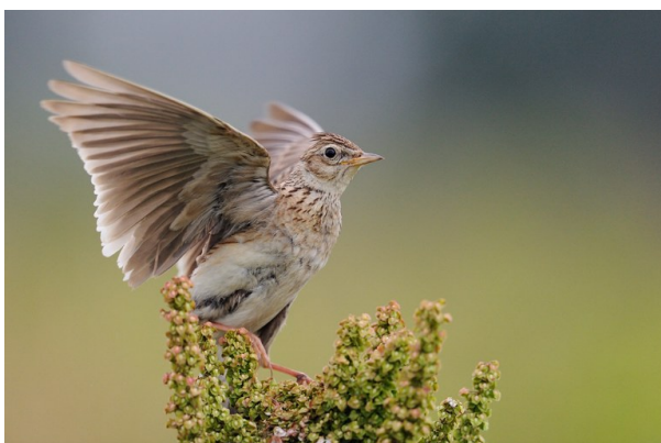
Vogel des Jahres, die Feldlerche

Die Feldlerche jubiliert immer seltener über unseren Feldern - ein weiteres Warnzeichen dafür, dass in der Landwirtschaft etwas gewaltig schief läuft. Der Naturschutzbund (NABU) hat die Lerche daher zum Vogel des Jahres 2019 gewählt – stellvertretend soll er auf die katastrophale Landwirtschaftspolitik in Berlin und Brüssel hinweisen.