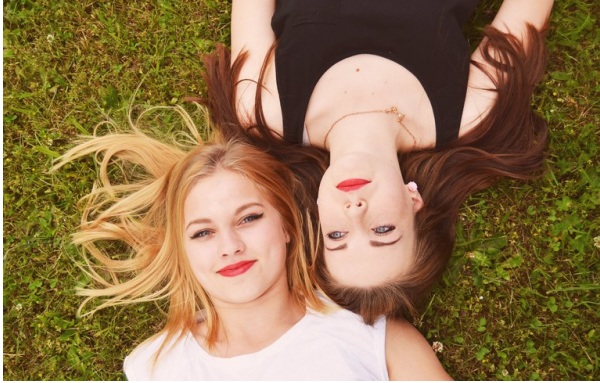
Monatshygiene - es geht auch nachhaltig

Die Hälfte der Menschheit erlebt sie und doch ist sie oft noch immer ein Tabu, die monatliche Menstruation. Zum Glück ändert sich das gerade, und dabei wird auch klar, dass konventionelle Binden und Tampons alles andere als nachhaltig sind. Die Baumwolle ist auf dem Feld in der Regel mit Glyphosat oder anderen Pestiziden behandelt worden, viele Produkte werden zudem chemisch und mit hohem Energieverbrauch gebleicht. Im Vlies und im Kern stecken verschiedenen Kunststoffe, zum Beispiel das saugfähige Kunststoffgranulat Natriumpolacrylat. Leider gibt es bisher keine Kennzeichnungspflicht für solche Inhaltsstoffe.