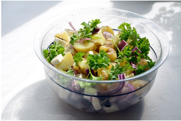
Kartoffelsalat, ob klassisch oder in anderen Varianten - lecker!

die Kartoffeln gern auch kombiniert mit Erbsen und/oder Blumenkohl.