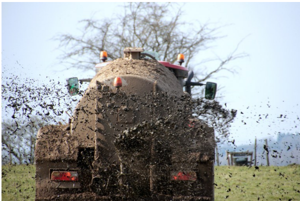
Überdüngte Böden und Gewässer gefährden die Gesundheit

800.000 Euro Strafe - pro Tag. So viel soll Deutschland zahlen, wenn hierzulande nicht endlich die EU-Nitratrichtlinie eingehalten wird. So steht es im Urteil des Europäischen Gerichtshofs vom letzten Juni. Die Bundesregierung hatte schon vor der Urteilsverkündung halbherzig am Düngerecht herumgebessert und Anfang 2019 dann weitere Vorschläge nach Brüssel gemeldet. Diese machten aber kaum Eindruck - die EU-Kommission fordert echte Nachbesserung, und zwar schnell, und sie droht mit einer zweiten Klage. Bis zum Frühsommer 2020 sollen effiziente Maßnahmen dafür sorgen, dass die Nitratgrenzwerte endlich eingehalten werden.